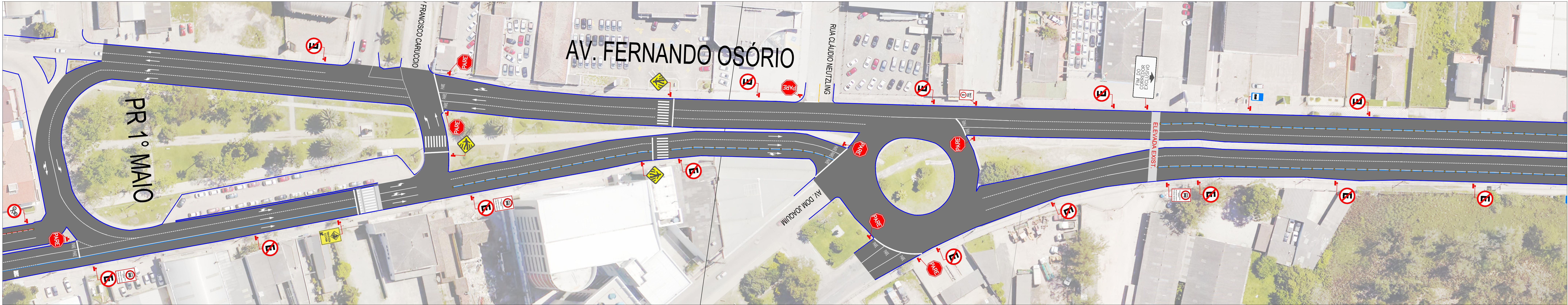
PLANTA BAIXA TRECHO PRAÇA DO COLONO E DOM JOAQUIM ESC. 1:1000